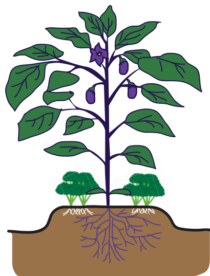
ナスの株元にパセリを植える。